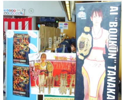
ムエタイ・キックボクシング

第3回 JCHO 仙台南病院健康まつりが、10月27日(土) 1F 外来ホールにて開催されました。当日は患者さんやご家族、地域住民の皆さんで賑わい、参加して下さった方々と交流を深めることができました。お楽しみステージ上では、和太鼓演奏で幕を開け、日本舞踊、ムエタイ・キックボクシング、サンビューバンド、青空応援団、東北学院大学アカペラサークルと次々と催し物が行なわれ、健康講話ブースでは副院長の「胆石症といわれたら」、薬剤科長より「そうだったのか!これですっきり!これで解決!後発医薬品(ジェネリック)」、認定看護師による「認知症あれこれ」地域の皆様に興味をもって聞いていただける講話を行ないました。その他、専門スタッフの健康チェック&相談コーナーや通所リハビリ・介護老人保健施設の紹介、病院体験コーナーでは調剤体験、白衣体験、キッズコーナーなどを設け、お子様から高齢者の方々まで楽しんで頂けたのではないかと思います。