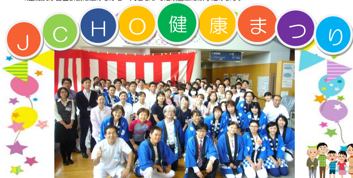
平成 30 年 10 月 27 日 (土) に第 3 回 JCHO 健康まつりを開催いたしました