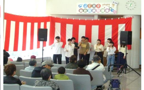
東北学院大学アカペラサークル