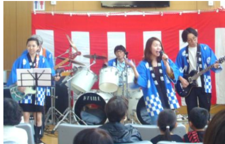
サンビューバンド