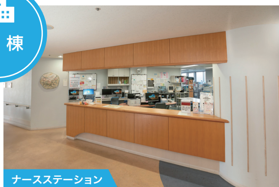
ナースステーション